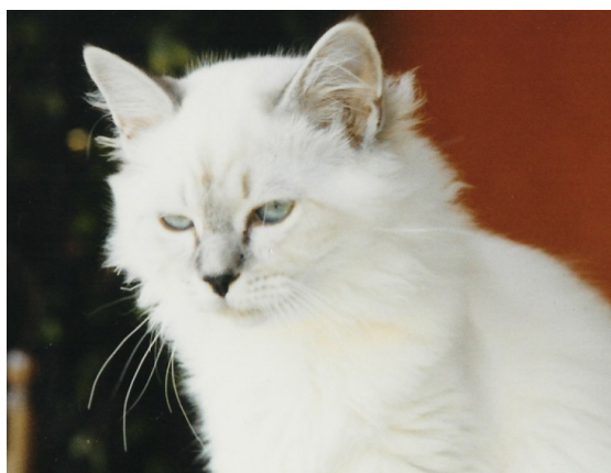
Markus de Saya San - seal silver tabby point

Cette partie de l'article ayant été rédigée au mois de mars 1999, il se peut que des chatons soient déjà nés. Je ne manquerai pas de vous tenir informé de la qualité de ceux-ci.